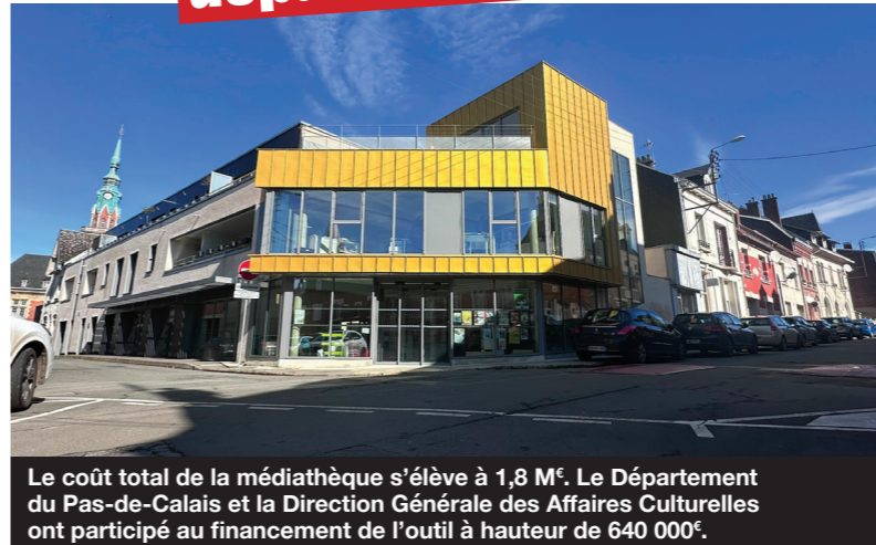
Le coût total de la médiathèque s'élève à 1,8 M€. Le Département du Pas-de-Calais et la Direction Générale des Affaires Culturelles ont participé au financement de l'outil à hauteur de 640 000€.

À l'intérieur, le décorum est époustoufflant. Les immenses baies vitrées conçues par l'architecte Arnaud Zisseler inondent l'espace de lumière, révélant des étagères métalliques aux teintes éclatantes. Ces 300 mètres carrés de rêverie sont dorénavant accessibles au public. En plus des 9000 œuvres exposées, le